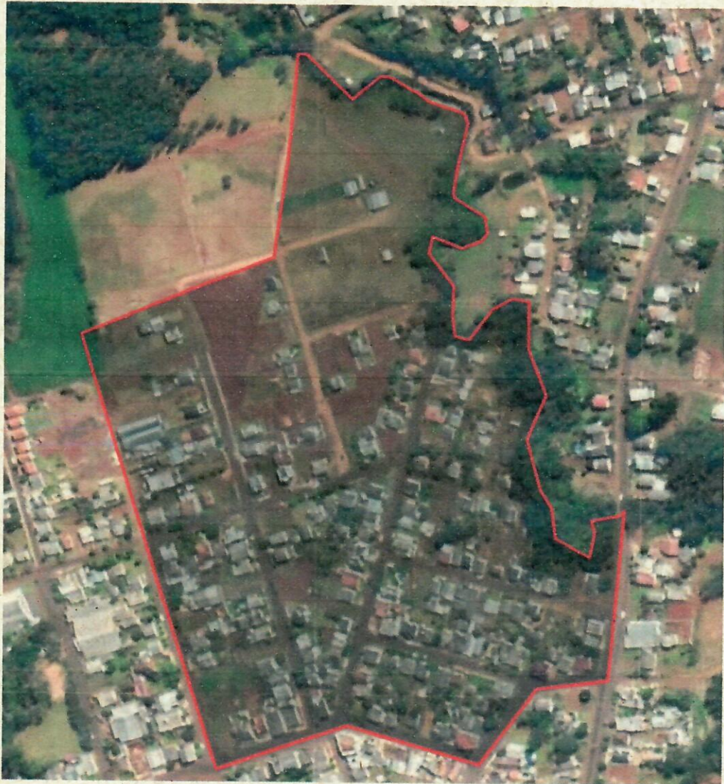
Vista de cima do Bairro do Erval

a divisa do Loteamento Peron e Loteamento Ida Siliprandi, daí segue a esquerda por essa divisa até encontrar o rio Taquaruçu daí segue o rio corrente acima até encontrar a ponte da RS 143 (Avenida João Mafessoni), daí segue a direita por essa avenida até encontrar a rua Francisco Anziliero, daí segue a direita por essa rua até encontrar a rua Ida Siliprandi, daí segue a direita por essa rua e segue até entroncamento com a rua Silvio Cezarotto, início da descrição.