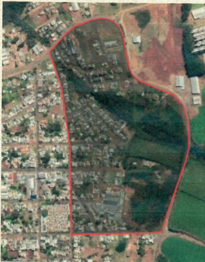
Vista de cima do Bairro das Laranjeiras

(RS143), daí segue a direita por essa Avenida até chegar no entroncamento com o Rio Taquaruçú, início da descrição.