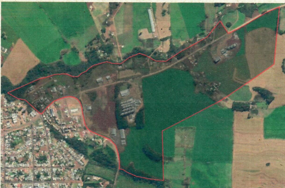
Vista de cima do Bairro das Comunicações